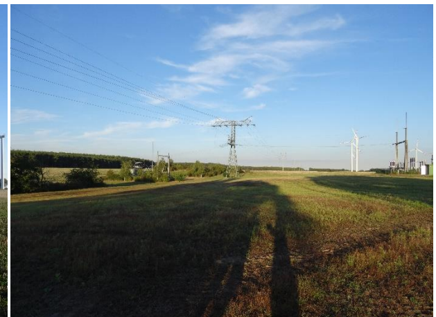
Abb. 3: bestehende Windenergieanlagen und intensive ackerbauliche Nutzung im Süden des Untersuchungsgebiets (Blickrichtung Süden)