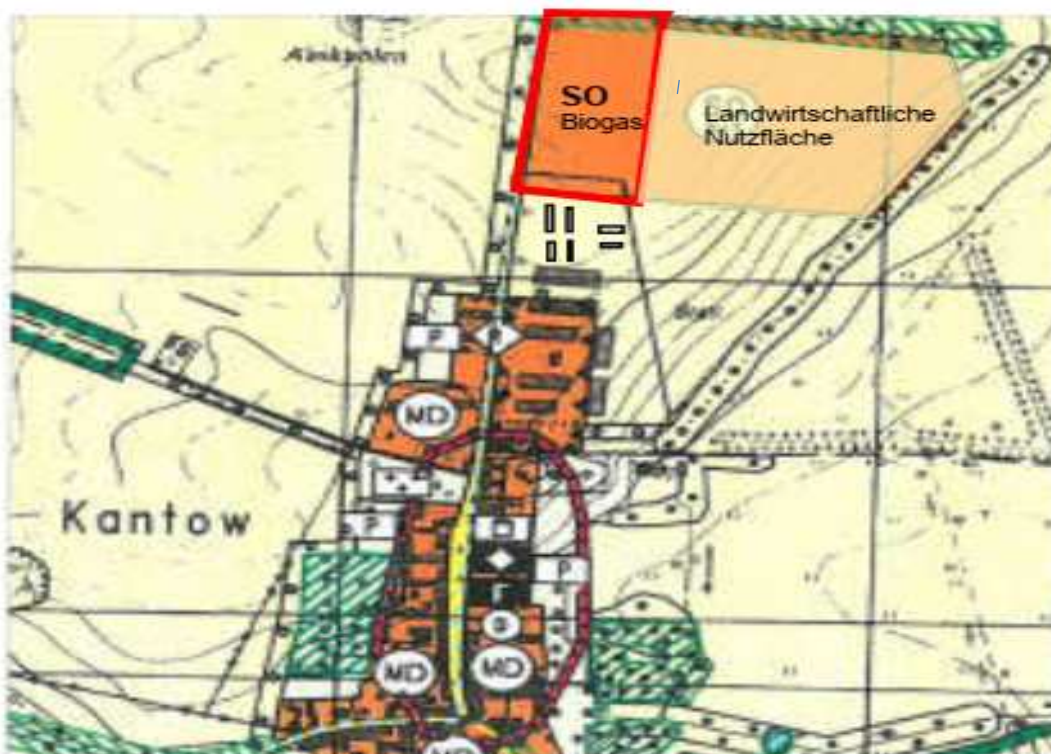
Abbildung 1: Übersichtskarte

Im rechtswirksamen Flächennutzungsplan der Stadt Wusterhausen/Dosse OT Kantow ist die künftig für ein Sondergebiet vorgesehene Fläche als 8 ha große Fläche für Biogas und Stallanlagen dargestellt. Diese Fläche wird auf 1,59 ha SO Biogas verkleinert. Da Bebauungspläne gemäß § 8 Abs. 2 Satz 1 BauGB aus dem Flächennutzungsplan zu entwickeln sind, muss dieser für die betroffene Fläche geändert werden.