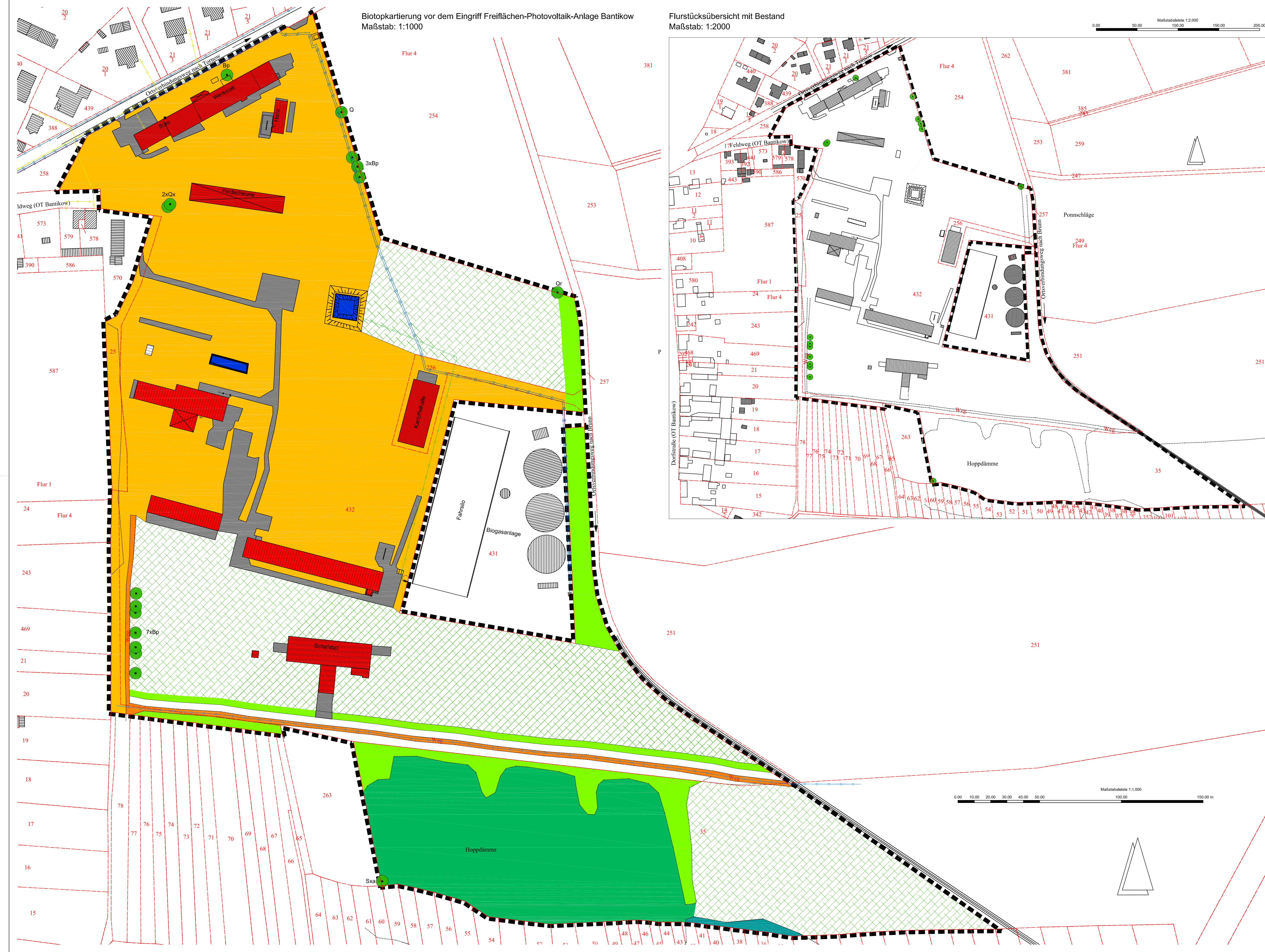
Flurstücksübersicht mit Bestand Maßstab: 1:2000